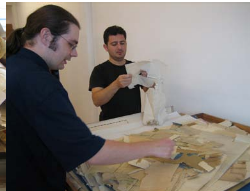
Archivmitarbeiter bei ihrer Arbeit