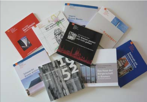
Die elf Bände unserer Schriftenreihe