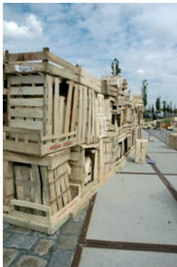
Architektur macht Schule