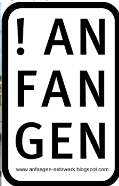
Logo der jungen Gestalter