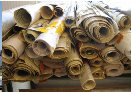
Architektennachlässe im Archiv